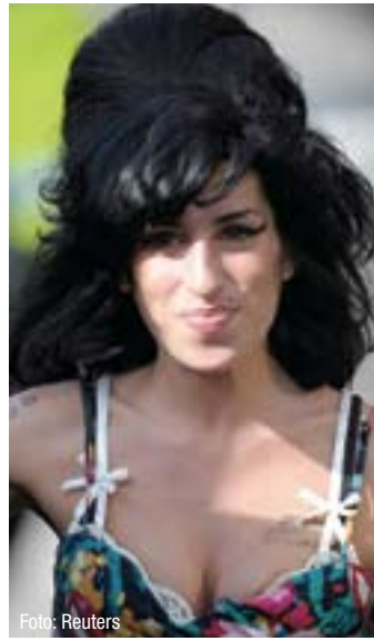
Gegen die Sucht von Amy Winehouse sind die Eltern ratlos.

Die Eltern von Soul-Sängerin Amy Winehouse (25) sind ratlos, was sie mit ihrer Tochter machen sollen. Beide befürchten, dass ihre Alkohol-Sucht sie irgendwann noch umbringen wird. „Amy nimmt zwar keine Drogen mehr, aber als Ersatz nimmt sie jede Menge Alkohol zu sich“, sagte Vater Mitch einem britischen Fernsehsender. „Ich will meine Tochter als vollständige Person zurück. Wir haben alles versucht. Wir haben gebettelt, sie zum Arzt geschickt, wir haben ihr gesagt, dass sie sich so umbringt. Nichts hat funktioniert. Wir sind machtlos“, fügte er hinzu. Besserung ist derzeit keine in Sicht.